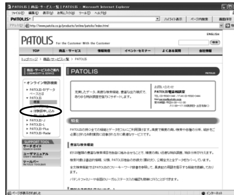
パトリスホームページ (http://www.patolis.co.jp/) > 商品・サービス > PATOLIS の「体験版申し込み」をクリック