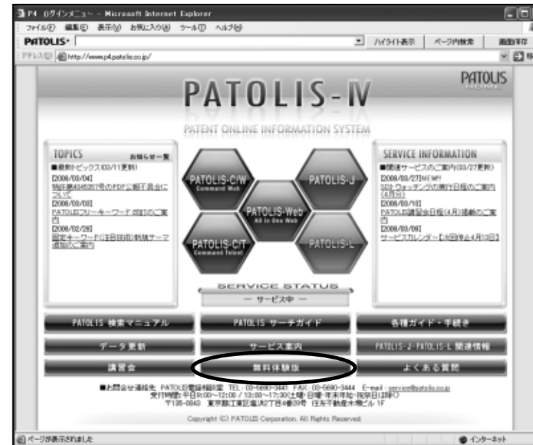
PATOLIS-IVホームページ (http://www.p4.patolis.co.jp/) の「無料体験版」をクリック